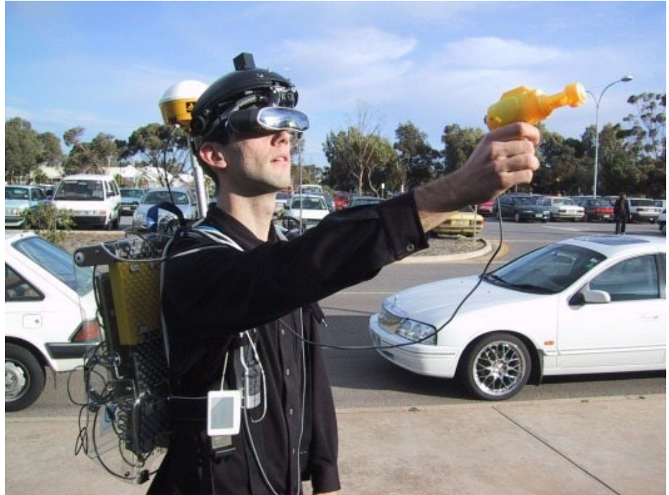
Figura 2 – Jogador utiliza dispositivos especiais para visualizar uma camada virtual sobre o espaço físico