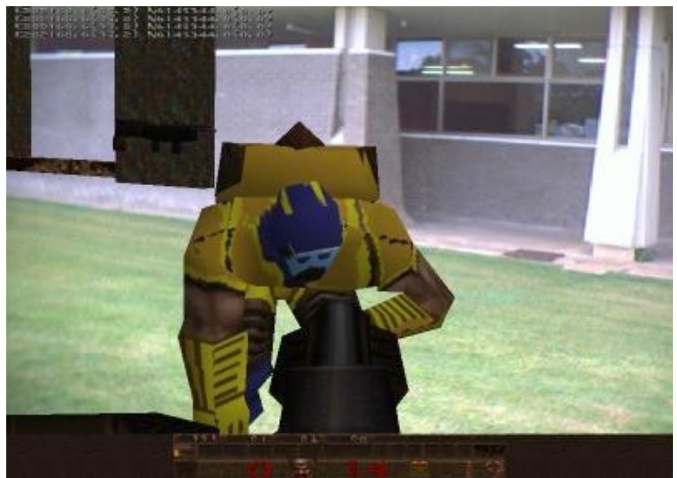
Figura 3 – Perspectiva do jogador de ARQuake mistura elementos virtuais e espaço físico