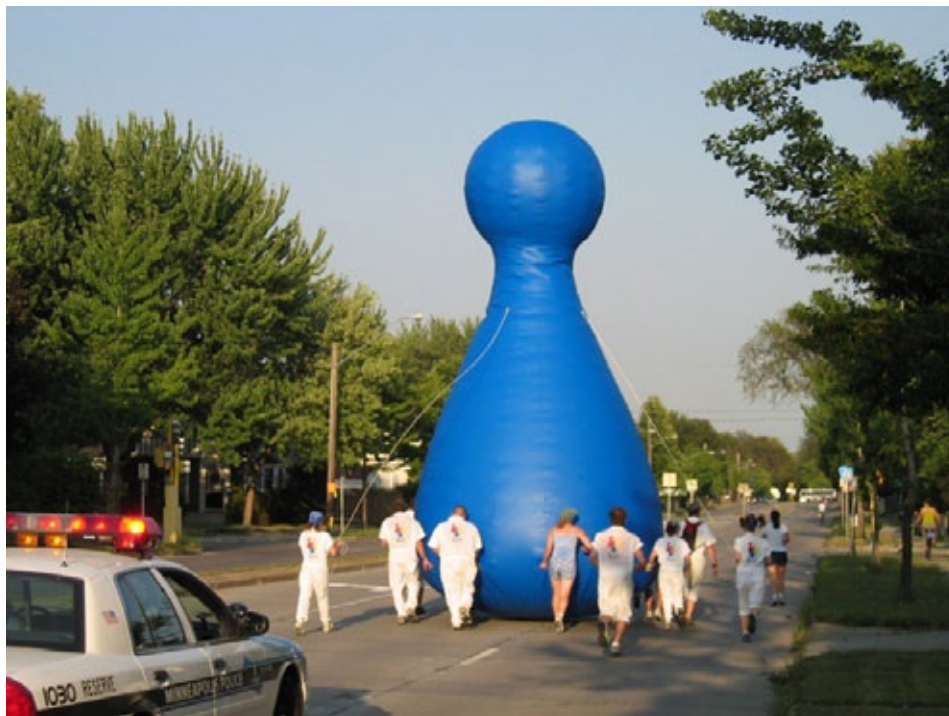
Figura 1 – Jogadores nas ruas movem a peça pela rota indicada por jogadores on-line

movem as peças entre os pontos, utilizando as rotas mais votadas. O tempo do percurso é registrado ao tempo total de cada equipe. Chegando ao ponto final, são calculados os tempos totais de cada equipe, e a que tiver realizado todo o percurso em menor tempo é considerada a vencedora 4 .